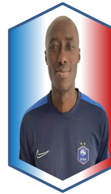
Elabo ELLOH CTD DAP